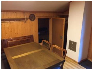
Eingang zu Twinbed

Preis pro Nacht für 2 Personen 110.-/ CHF Preis für weitere Personen 10.-/ CHF Kinderbett die Woche 50.-/CHF Endreinigung 120.-/CHF